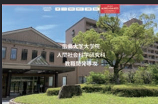
広島大学大学院 人間社会科学部研究科 様

WEB サイト制作実績 一例をご紹介 https://applied-g.jp/web_development/works/