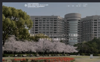
名古屋大学大学院 医学系研究科様