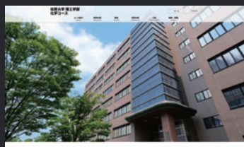
佐賀大学 理工学部 科学コース様