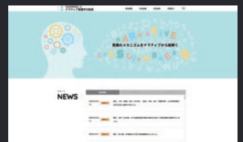
国立研究開発法人 情報通信研究機構 様